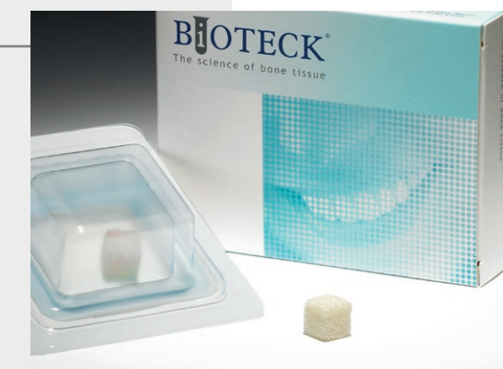
BGB-11 Bio-Gen Bloque Hueso Esponjoso 1 ud 10 x 10 x 10 mm BGB-12 Bio-Gen Bloque Hueso Esponjoso 1 ud 10 x 10 x 20 mm BGB-30 Bio-Gen Cuña Hueso Esponjoso 1 ud 25 x 10 x 5 mm (extremo 2 mm)