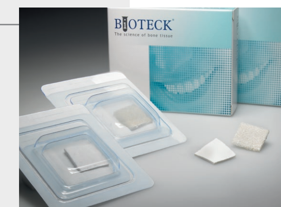
OTC-C1 Osteopant cortical flexible 1 ud 25 x 25 x 2-2,5 mm OTC-S1 Osteopant esponjosa flexible 1 ud 25 x 25 x 3 mm