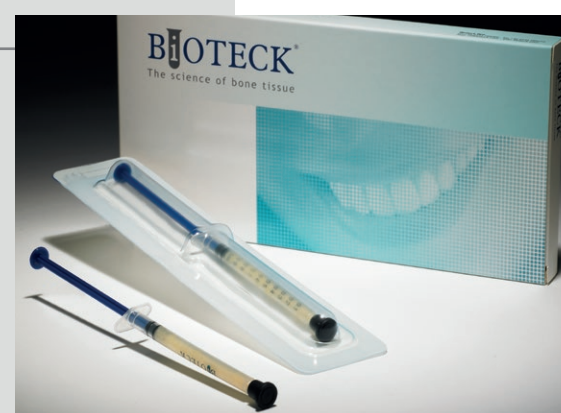
BCG-GEL1 Biocollagen Gel Gel de colágeno 3 jer 1 ml/jer