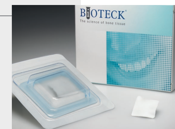
OTC-CE Osteopant membrana cortical 1 ud 25 x 25 x 0,2 mm OTC-CE2 Osteopant membrana cortical 1 ud 50 x 25 x 0,2 mm