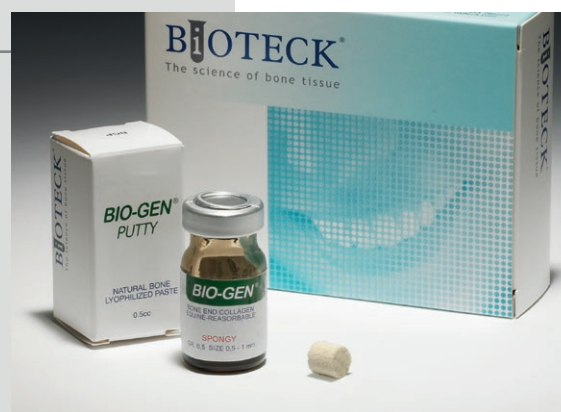
BGP-01 Bio-Gen Putty Pasta liofilizada esponjosa 6 env 0,5 cc