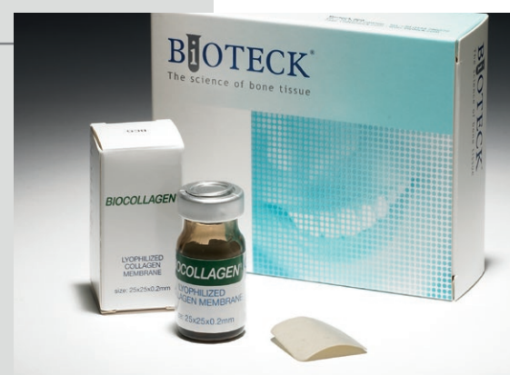
BCG-01 Biocollagen Membrana Membrana de colágeno 6 env 25 x 25 x 0,2 mm BCG-04 Biocollagen Membrana Membrana de colágeno 1 ud 40 x 30 x 0,2 mm